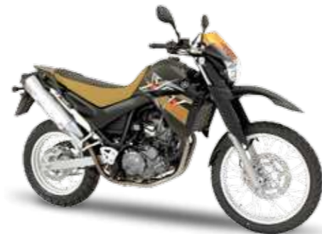
XT660R – Yamaha Black (YB)