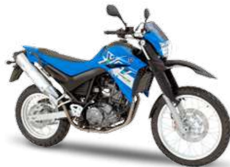
XT660R – Racing Blue (DPBSE)